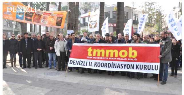
tmmob TMMOB MÜHENDİS VE MİMAR ODALARI BİRLİĞİ DENİZLİ İL KOORDİNASYON KURULU