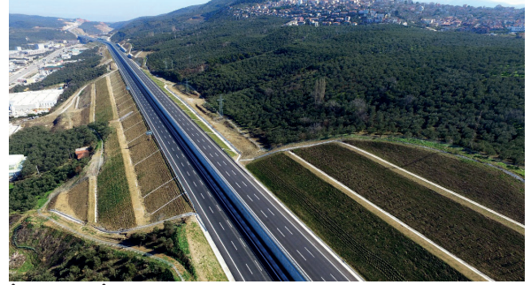
İstanbul-İzmir Otoyolu (15)

İstanbul-İzmir Otoyolu Projesi sayesinde Balıkesir ve Manisa illeri, İstanbul ve Bursa çevresindeki bölge kapasitesinin üzerine çıkmış sanayi yatırımlarının yeni çekim alanı haline geldiği belirtilmektedir.(14)