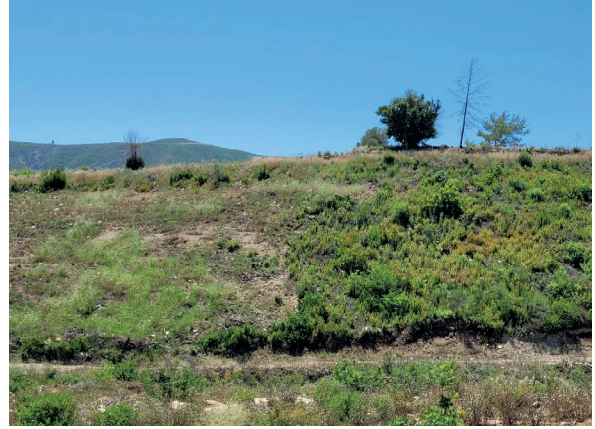
Şekil 5. Yangın sonrası toprak işleme yapılarak dikim yapılan saha (solda) ve kendi haline bırakılan saha (sağda) (Manavgat). Fotoğraf yangından sonra 4. yıla ait olup, toprak işleme yapılan sahanın vejetasyonunun zayıflığı açık şekilde görülmektedir.

yerel tohum kaynaklarının kullanılması ve tohum transferi kurallarına riayet edilmesi gerekmektedir. Bu uygulamalarda tam alan toprak işleme yerine şeritler halinde müdahale edilmesi, hem ekolojik hem de teknik açıdan daha uygun bir yaklaşımdır (Şekil 5).