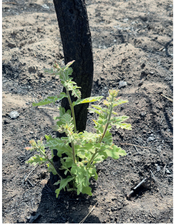
Şekil 1. Karaçam ormanında (Eskişehir) yangından kısa bir süre sonra sürgünden meydana gelmiş Türk meşesi gençliği.