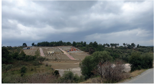
Tahtalı Baraj Havzası hobi bahçesi

Hobi bahçeleri orman ve tarım alanları ile iç içe olan Tahtalı İçme suyu havzasında da görülmeye başlanmıştır.