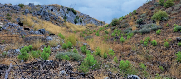
Şekil 4. Yangın sonrası doğal olarak gençleşmiş kızılçam gençlikleri (Marmaris).

genleşme süreci sergileyebilmektedir (Şekil 4). Bu adaptasyonların başlıcaları; geç açılan kozalaklar (seratoni), kalın kozalak karpelleri ve tohum kabukları sayesinde tohumların canlılığını koruyabilmesi