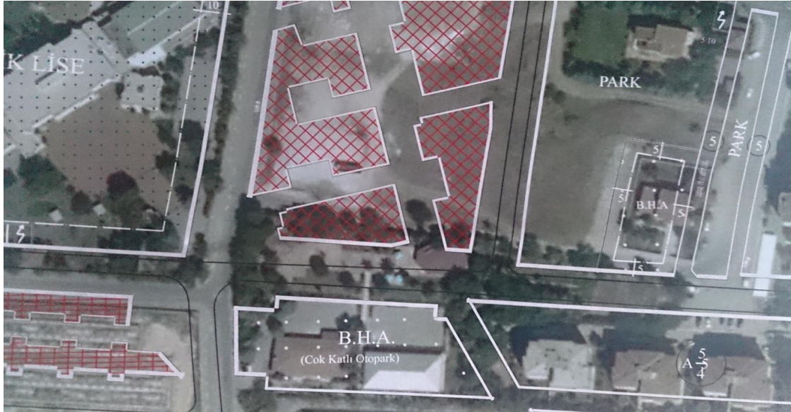
Resim 5: Alanın plan değişikliği öncesi durumu ve mevcut kullanımın karşılaştırması.

Diğer yandan, yürürlükteki planda park alanı olarak planlanmamış bir alan, fiili durumda park alanı olarak bulunmaktadır. Buna ilişkin yapılan araştırmada; 1990 öncesi planlarda bu alanın park alanı olarak planlı olduğu ve yürürlükteki 1/1.000 ölçekli Fethiye İhsaniye Revizyon Uygulama İmar Planı ile bu alanın park alanı olmaktan çıkarıldığı yönünde bilgilere ulaşılmıştır. Bu konudaki araştırma devam etmektedir.