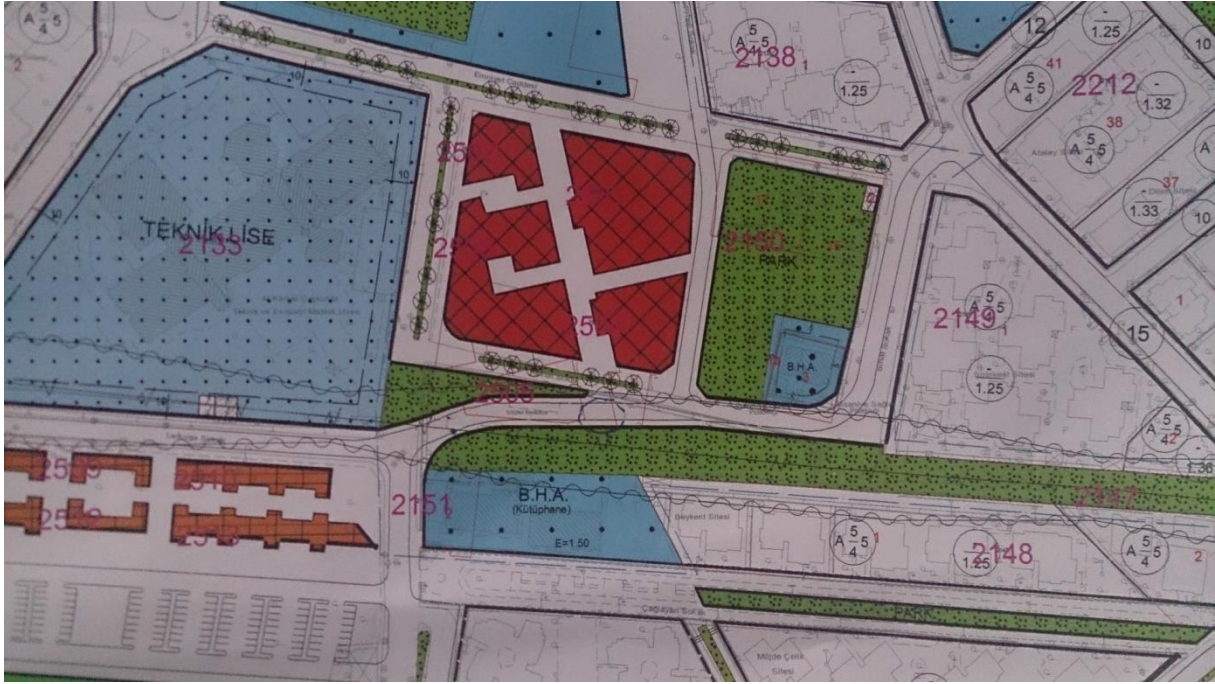
Resim 6. Onaylanan plan değişikliği