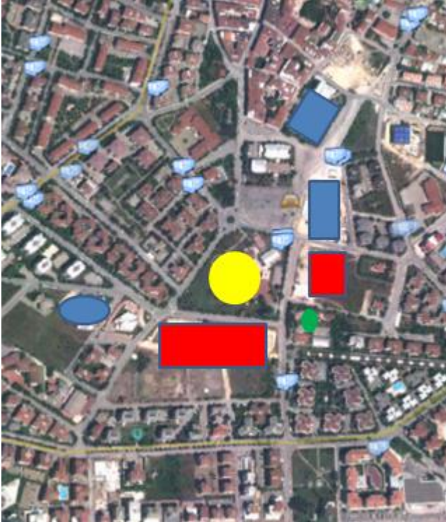
Resim 3. Alan çevresindeki ticaret, konut, kamusal alanlar.