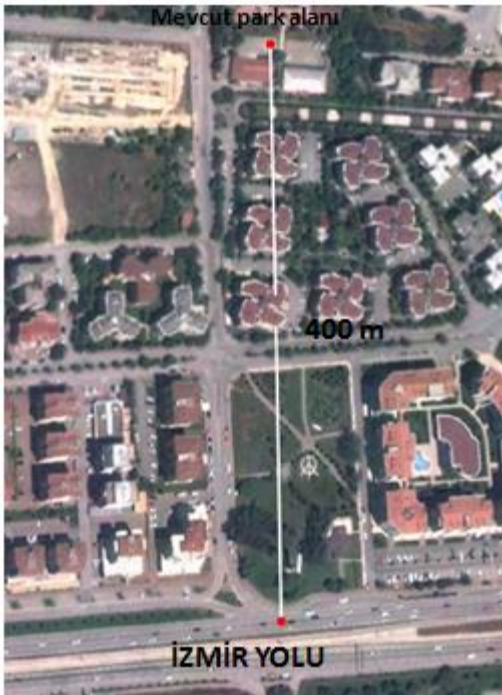
Resim. 1. Alanın İzmir yolu mesafesi.

Alanın kuzeyinde Nilüfer Belediye Binası ( Nilüfer Halk Evi ), Vergi Dairesi, Evlendirme Dairesi ve Okul alanı gibi kamusal alanlar yer almakla birlikte, batısında Agora, Pazar Alanı ve Buzpark gibi ticari fonksiyonlar yer almaktadır. Alanın büyüklüğü yaklaşık 4.000 m 2 dir. ( Resim 2 -3 )