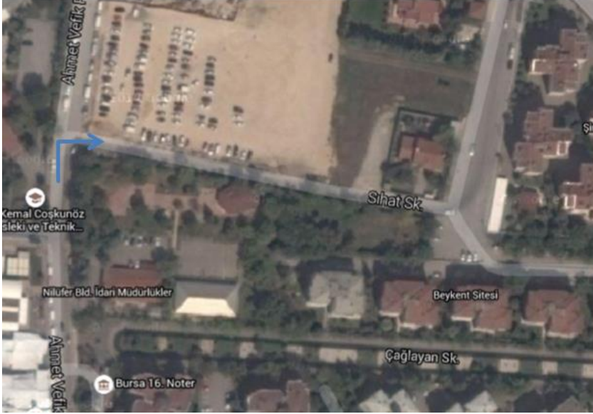
Resim 7. Sihat sokak dönüş kuru