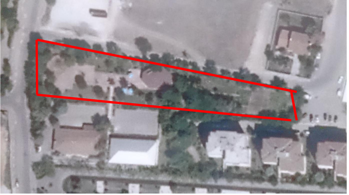
Resim 2. Alanın yaklaşık sınırları.