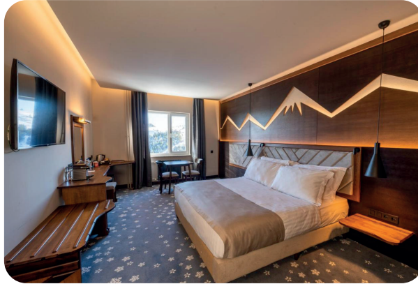
Fotoğraf 5. Bir Yatak Odası Görüntüsü (internet); Otomatik Yangın Algılama Cihazı Görülmemektedir

Aşağıda belirtilen binalarda yangın uyarı butonlarının kullanılması mecburidir: