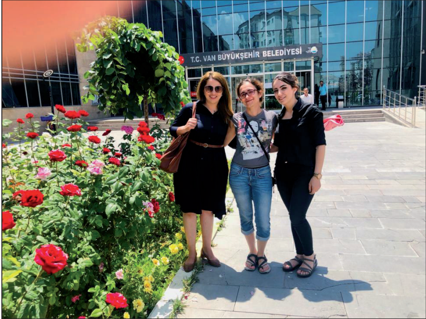
Foto 3. Davetiyelerin dağıtılması 28.06.2019, Van Büyükşehir Belediyesi önü

Bunlara ek olarak, STK'lar, belediyeler, parti temsilcilikleri ve kadın örgütleri ziyaret edilerek, davetiyeler dağıtıldı; başta belediye eş başkanları, şube müdürleri, yetkililer olmak üzere ve yönetici kadınlarla birlikte çalışan kadınların tümü de kurultayımıza davet edildi (Foto 3.). 3