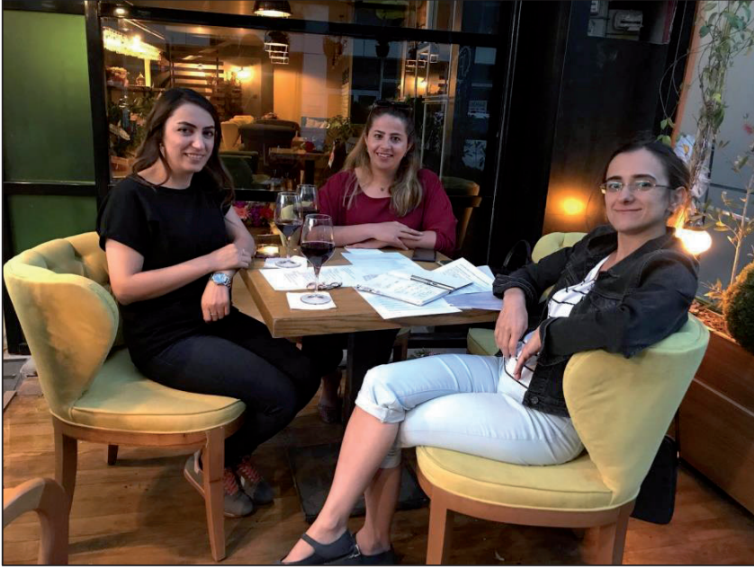
Foto 2. TMMOB Van İKK Kadın Çalışma Grubu 13.06.2019, Hera Boutique Cafe, Van

İlkin biz TMMOB Van İKK'daki üç kadın olarak, kendi mesleki örgütlülüğümüz ve mesleğimizi icra ederken karşılaştığımız sorunları kurultayda dile getirmenin anlamlı olacağına karar verdik. Kurultay yapma hedefimizi TMMOB Van İKK üyeleriyle 29 Mayıs 2019 tarihindeki toplantıda paylaştıktan sonra MO Van Şubesi'nden bir arkadaşımızın da katılımıyla Van İKK Kadın Çalışma Grubunu kurduk (Foto 2).