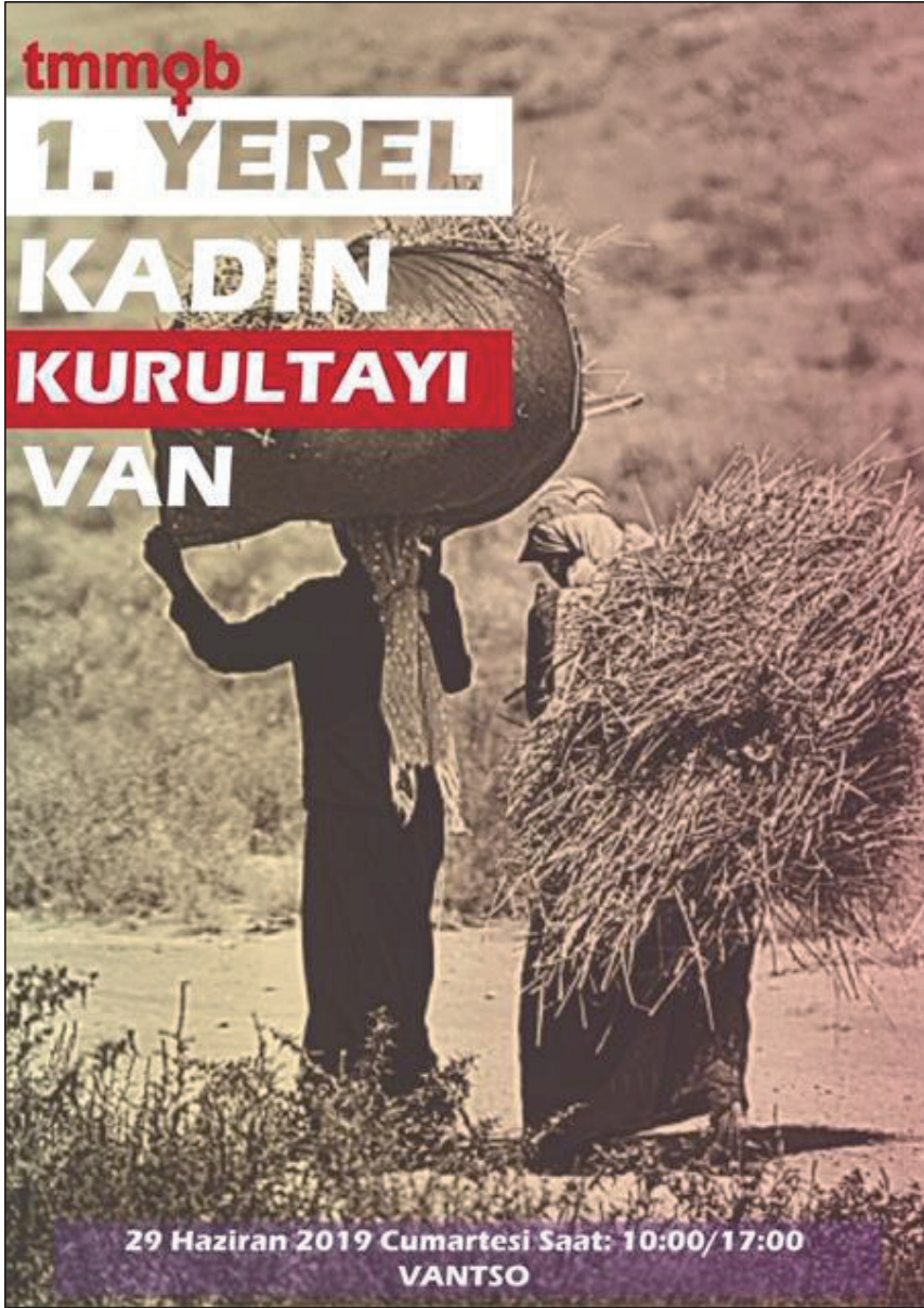
Foto 1. Kurultay Afiş ve Broşür Kapağı