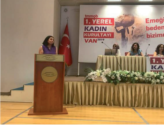
Foto 9. Serbest kürsümüzden bir kare