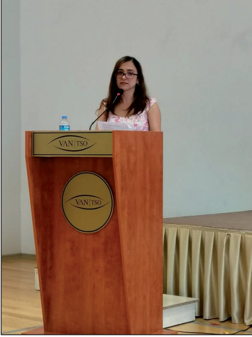
Foto 5. TMMOB Van İKK Kadın Çalışma Grubu Adına Açılış Konuşması