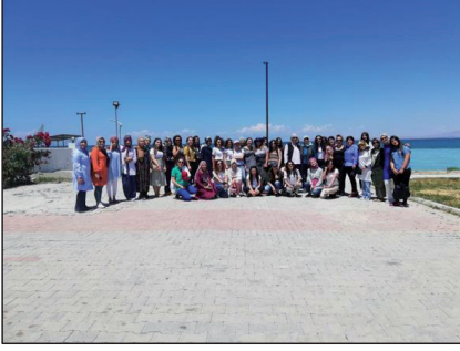
Foto 13. Van Kahvaltısı sonrası toplu fotoğraf