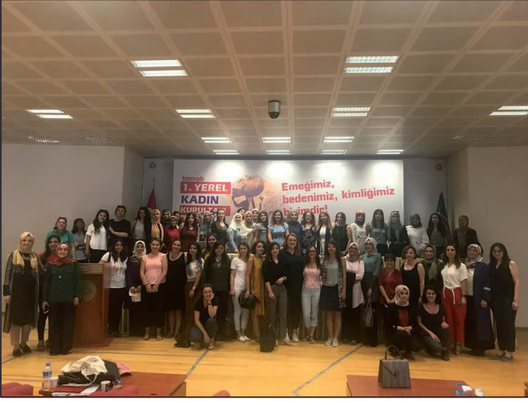
Foto 10. Oturum sonrası toplu fotoğraf

Bu heyecan ve paylaşımlar nezih bir butik kafede gece boyunca katılımcıların yaptığı müzik ve şiir dinletisi eşliğinde devam etti.