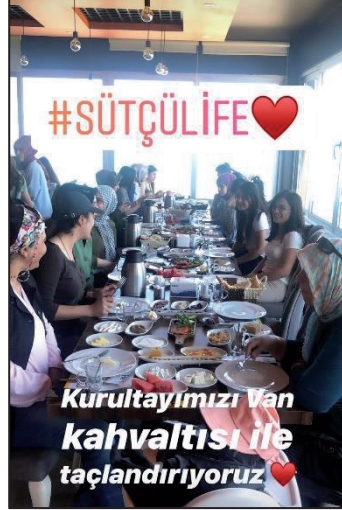
Foto 11. Van Kahvaltısı sosyal medya paylaşımı