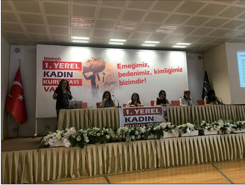
Foto 8. 1. Oturum'dan bir kare