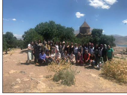
Foto 14. Akdamar Adası gezisi toplu fotoğraf