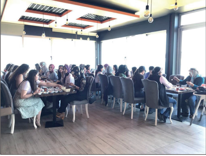
Foto 12. Van Kahvaltısı

gözlendi. Sonrasında daha güzel etkinlikler yapılması yönünde planlar yapıldı.